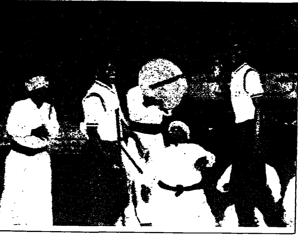
راضتنا .. سعودية .. وكاس العالم .. جعلناها .. سعودية ..